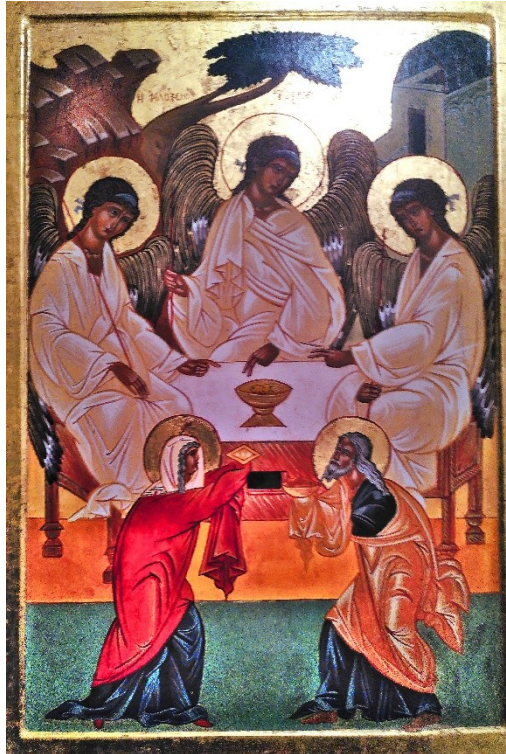
Icône du Chêne de Mambré (Abraham, Sarah et les trois hommes de Dieu)