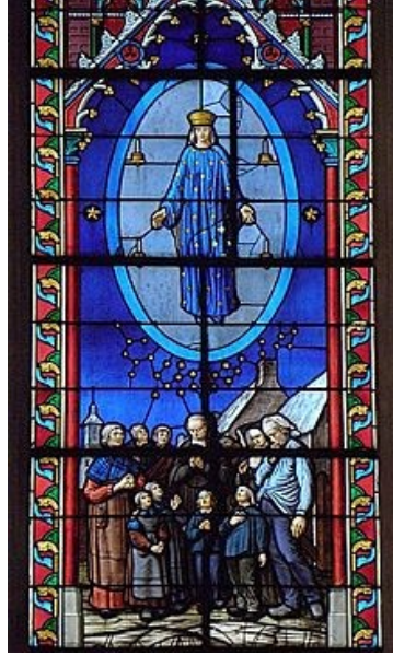
Vitrail de l'apparition de Pontmain

« Un grand signe apparut dans le ciel : une Femme, ayant le soleil pour manteau, la lune sous les pieds, et sur la tête une couronne de douze étoiles. Elle est enceinte, elle crie, dans les douleurs et la torture d'un enfantement. » (Ap 12, 1-2)